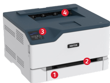
Impresora Xerox® C230 Color