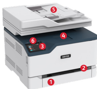
Equipo multifunción color Xerox® C235